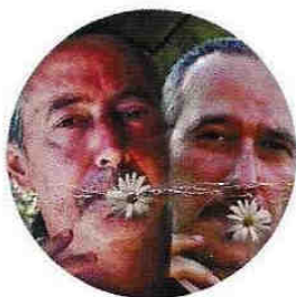
Pomar e Noto 18 Luglio