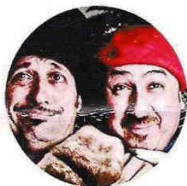
Bottega Retrò 25 Luglio